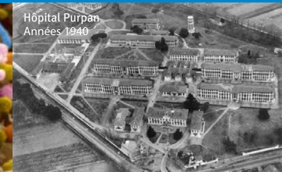
Hôpital Purpan Années 1940